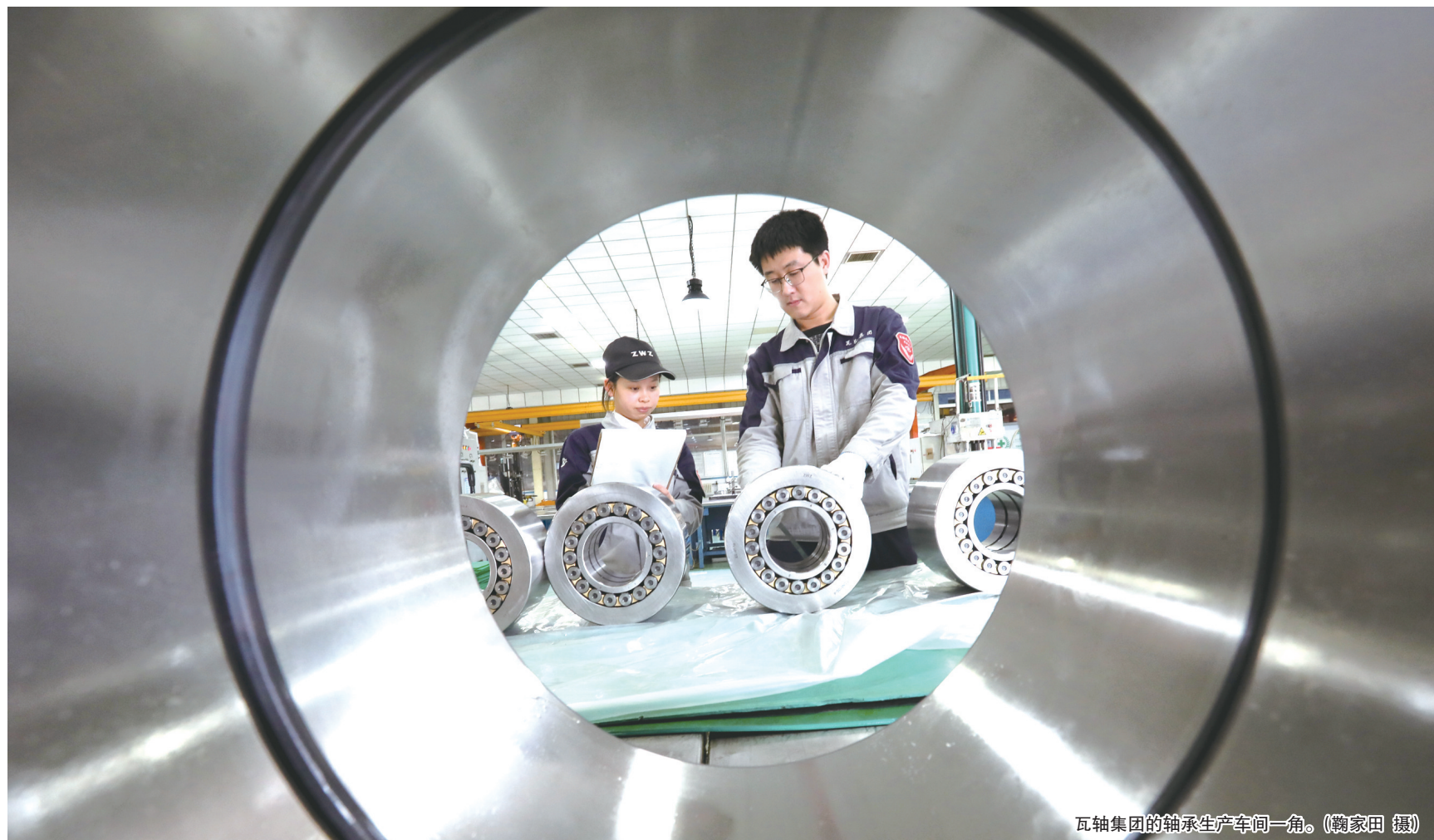
瓦轴集团的轴承生产车间一角。