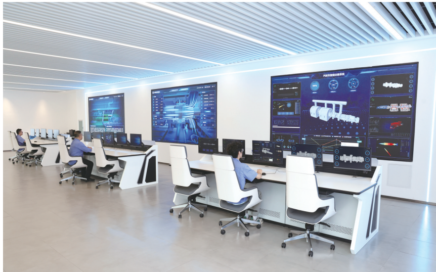
哈电发电设备国家工程研究中心研发基地智能化产品开发实验室。

心使命，在共和国机电工业发展史上留下了坚实的足迹。进入新时代，哈电汽轮机坚持深入学习贯彻习近平总书记关于国有企业改革发展和党的建设的重要论述精神，以改革赋能企业高质量发展，实现了从“中国制造”到“中国创造”的跃升。