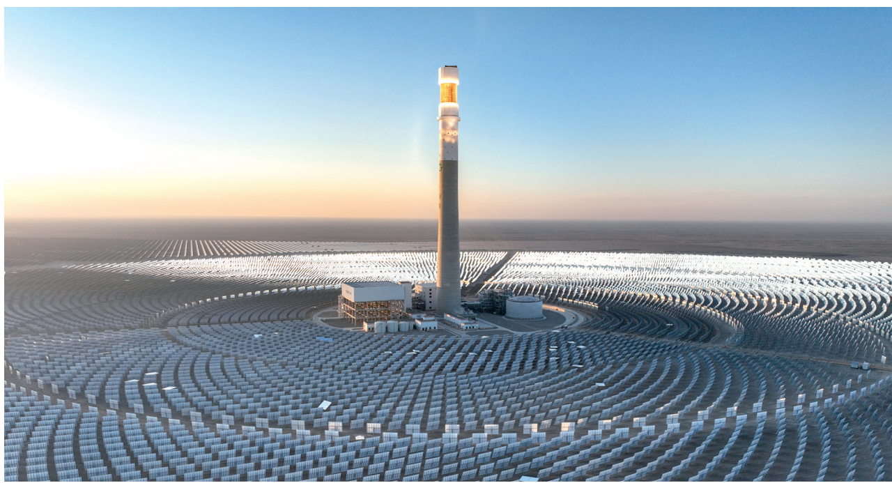
2025 年 12 月 8 日, 在甘肃省酒泉市金塔县白水泉光电产业区的戈壁滩上, 金塔多能互补基地“10 万千瓦光热+60 万千瓦光伏”项目在阳光照射下熠熠生辉, 成为大漠戈壁间一道亮丽的绿色发展风景线。

党的二十届四中全会提出, 建设现代化产业体系, 巩固壮大实体经济根基。加快高水平科技自立自强, 引领发展新质生产力。2025 年 12 月 10 日至 11 日, 中央经济工作会议在北京举行。会议指出, 过去 5 年, 我国有效应对各种冲击挑战, 推动党和国家事业取得新的重大成就, “十四五”规划即将圆满收官, 第二个百年奋斗目标新征程实现良好开局。